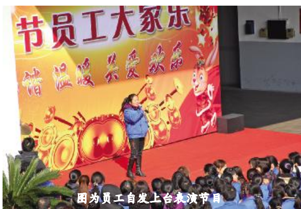
图为员工自发上台表演节目

欢聚一堂,共庆新春。 “新春和节目表是‘心系员工、贝发送’工程的重要内容,努力营造热烈、和谐、温馨的春节氛围,让员工充体会到集团的关心”监事会、党委、工会总负责人吴远平介绍说。 除新春和节目表外,集团还为每位员工了新年礼金。“心系员工贝发送”工程是贝发集团为员工精心,旨在为员工营造和谐的新春氛围。一个月以来,先后举行了亲情出,欢乐套圈、精彩球、味保龄球等游艺活动,行政中心为一员工送点心、访、慰问庭困难伤病员工等活动。 集团还为留公司过年的外籍员工了丰的年夜饭,元宵佳节为员工提汤圆和丰富多彩的元宵灯谜会。