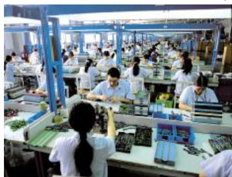
▼鼓足干劲地员工正全身心投入工作