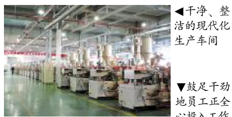
▲干净、整洁的现代化生产车间