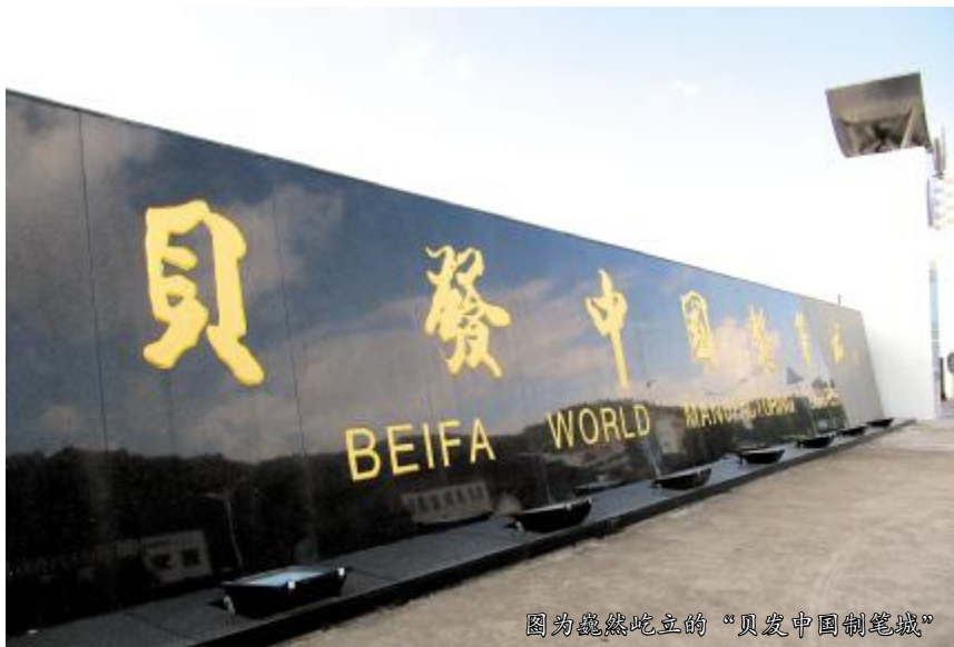
图为巍然屹立的“贝发中国制笔城”